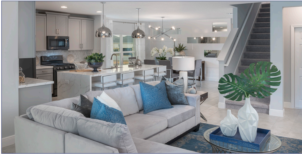
La Wilshire - Familie Room