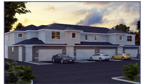
La Réserve Etrusque

Idéale comme résidence secondaire, elle pourra par ailleurs être facilement louée et vous faire bénéficier d'un excellent investissement locatif. Prix à partir de 240 000 Euros.